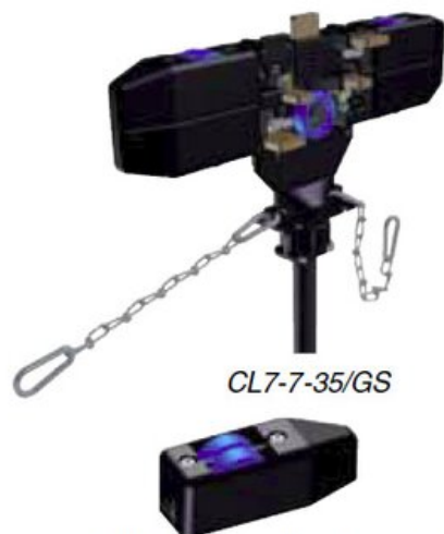
Gliding shoe with wheel set for type 'GS'-collector trolleys